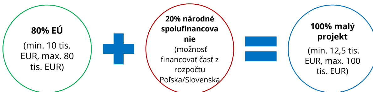
SCHÉMA 1. FINANCOVANIE MALÉHO PROJEKTU

Financovanie oprávnených výdavkov v malých projektoch vyzerá nasledovne: